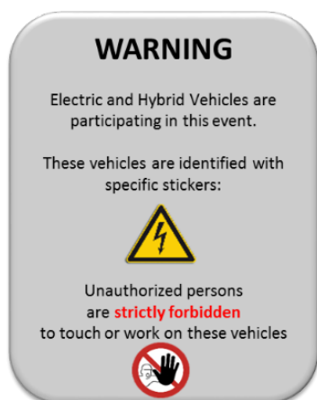
Exemple de ticket

Il est recommandé d'afficher un document d'une page dans des endroits visibles (entrée/sortie des stands, guichets d'accueil, à proximité des zones publiques, etc.).